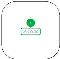
1 - Logo sa svjetlosnim indikatorom.